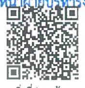
สิ่งที่ส่งมาด้วย

ที่ทำการปกครองอำเภอ สำนักงานอำเภอ (งานบริหารทั่วไป)